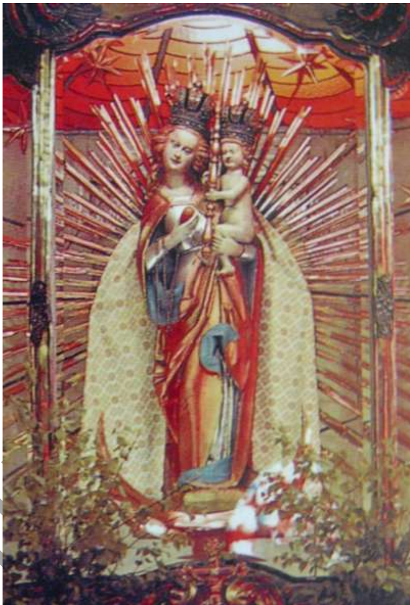
Dvůr Králové kostel – soška P. Marie